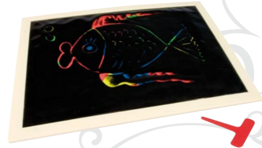
Malotafel: il primo prodotto realizzato da GONIS

L'azienda è partita inizialmente con la vendita di prodotti per bambini ad asili e scuole. Successivamente GONIS ha sviluppato un sistema di vendita diretta, che la vede da molti anni operativa con successo in Germania, Austria e Svizzera. Dal 2003 GONIS è membro dell'associazione di categoria Bundesverband Direktvertrieb Deutschland e.V.